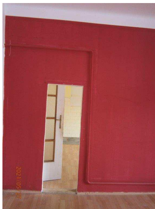
Prostup mezi kuchyní a pokojem