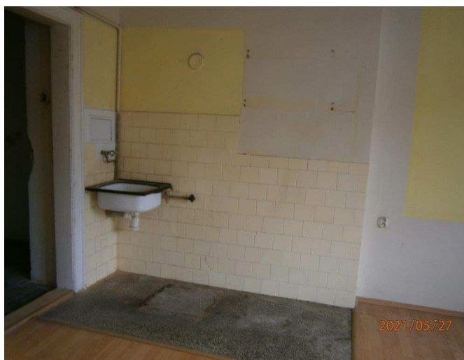
Kuchyň – obklad a vybavení