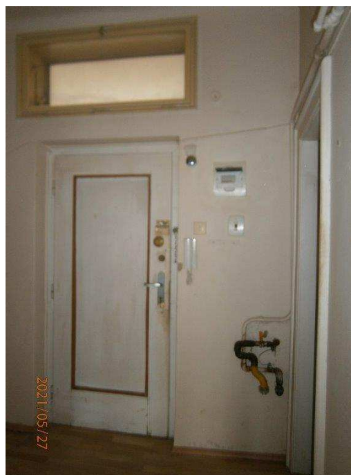
Vstupní dveře – pohled zevnitř