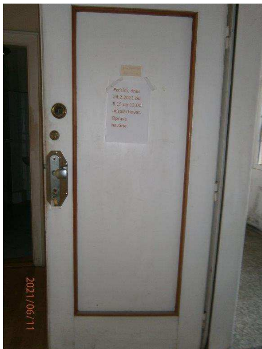
Vstupní dveře – pohled z venku